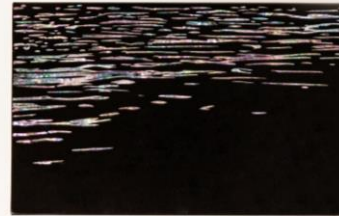
장철영 <통영바다의 운슬>