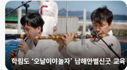
학림도 '오늘이야놀자' 남해안별신굿 교육