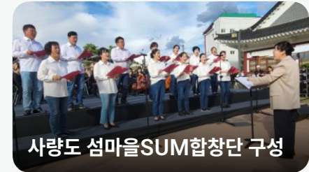
사랑도 섬마을SUM합창단 구성